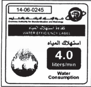
2-Star Label Design