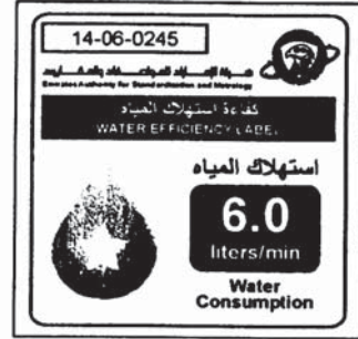
1-Star Label Design